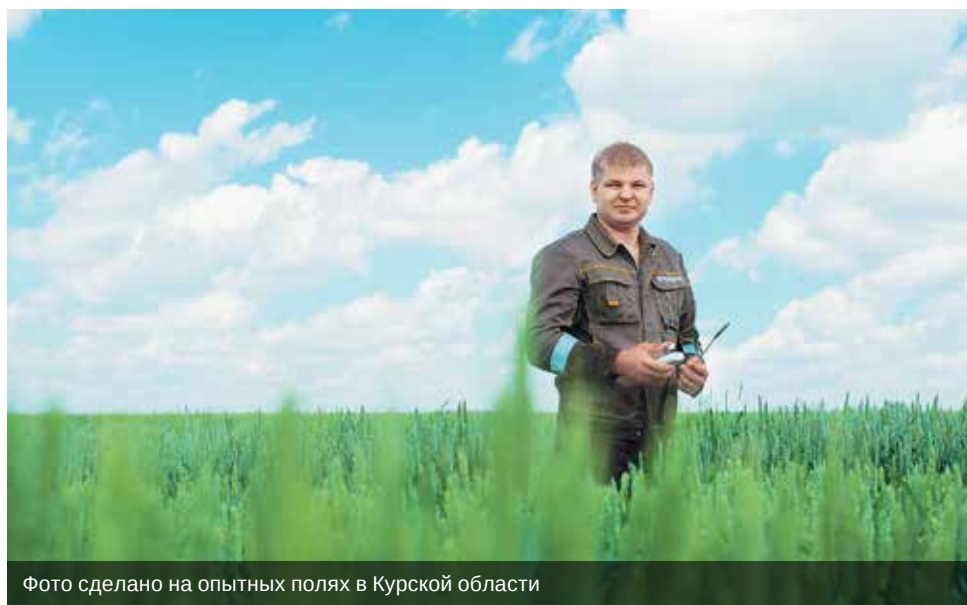
Фото сделано на опытных полях в Курской области